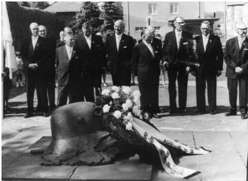
Totenehrung am Duisdorfer Ehrenmal zum 60. Jubiläum 1966

1966 feierte der Verein sein 60 - jähriges Bestehen. Vom 5. bis 12. Juni 1966 sorgte man täglich für sportliche und gesellige Veranstaltungen. Die Duisdorfer Bevölkerung nahm regen Anteil an diesem Jubiläum.