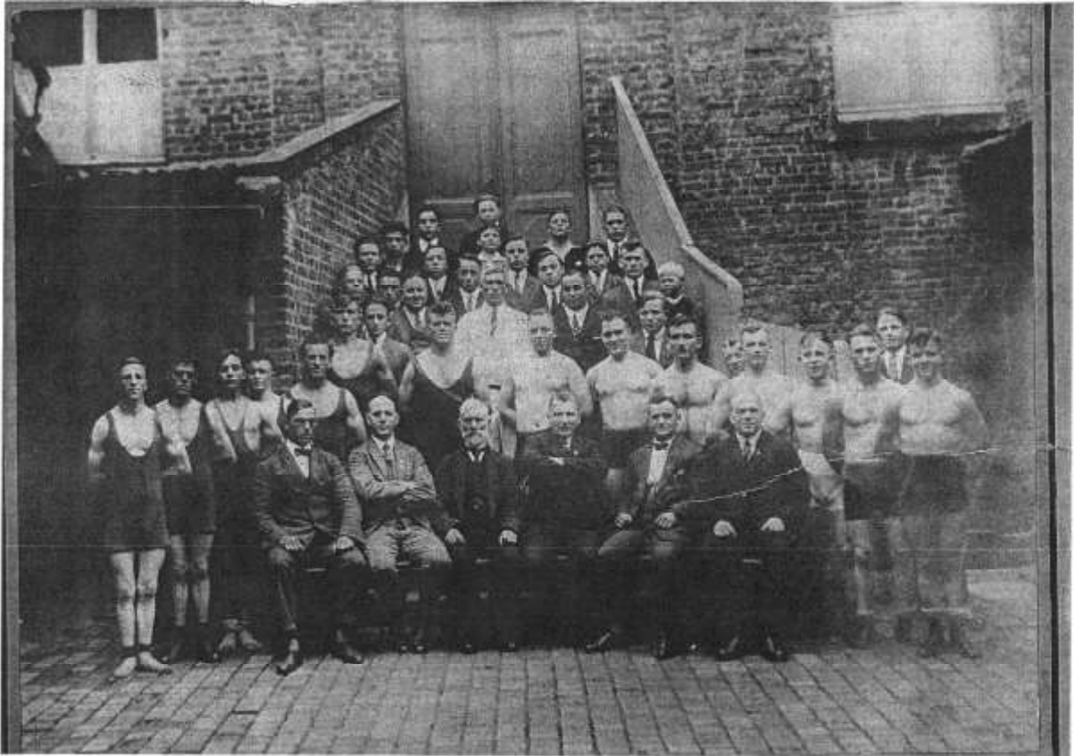
Gruppenfoto 1926 (hinter dem heutigen Kulturzentrum)