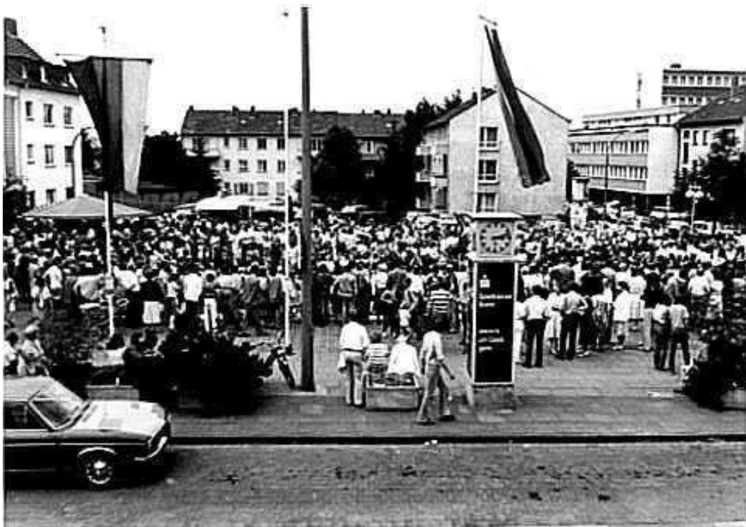
Der Schickshof während der Festveranstaltung

Vom 06. bis 14. Juni 1981 feierte der Verein sein 75 jähriges Jubiläum unter der Schirmherrschaft von Josef Ertl , in Duisdorf ansässiger Minister für Ernährung, Landwirtschaft und Forsten. Pfingstsamstag eröffnete ein großer bunter Abend die Festwoche. Mit Ehrung der verstorbenen und gefallenen Mitglieder am Ehrenmal, einem Festakt in der Aula der Rochusschule und einer Jugenddisco in der Sporthalle erfolgte die Fortsetzung. Pfingstmontag stellte sich der Jubiläumsverein auf dem Duisdorfer Schickshof der Bevölkerung vor.