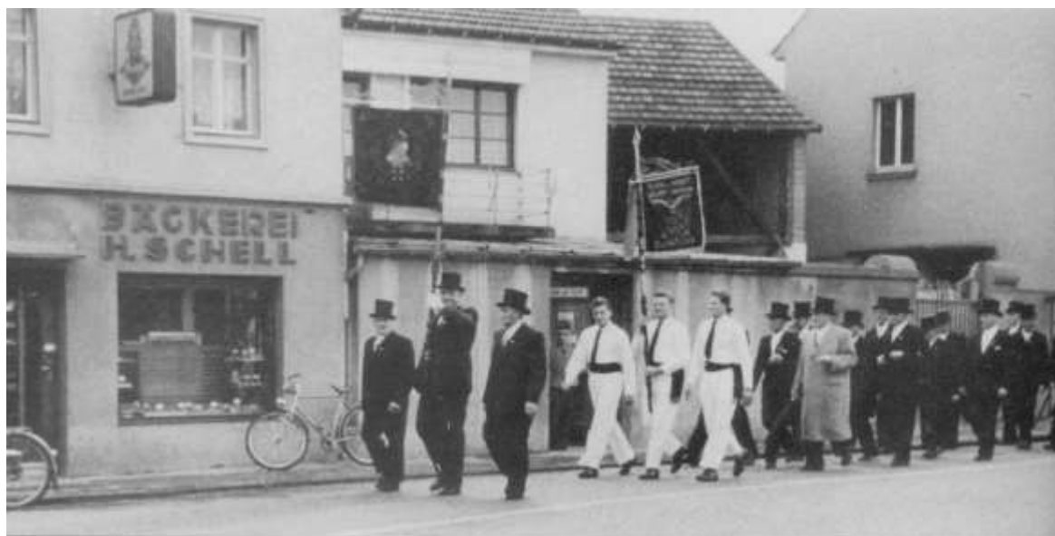
Festzug anlässlich des Jubiläums 1956