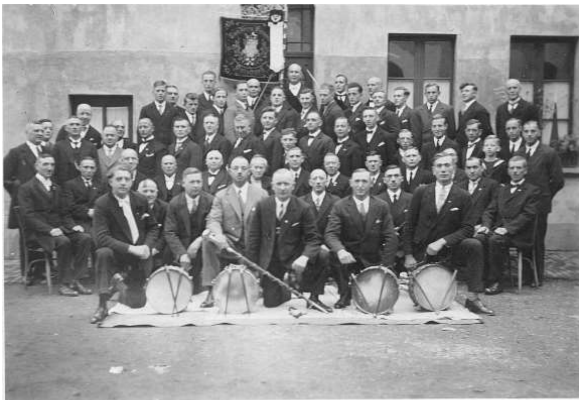
Gruppenbild der Mitglieder zum Stiftungsfest 1931

Die vielen anerkennenden Reden, die der Vorstand beim „Silbernen“ entgegennehmen durfte, waren voll berechtigt und gaben den Mitgliedern neuen Ansporn, ihre sportlichen Leistungen noch zu steigern.